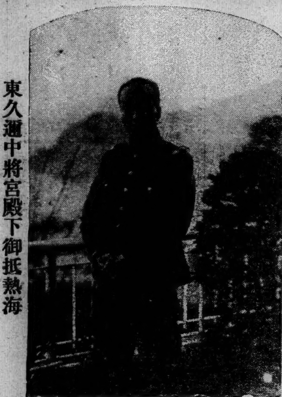
東久瀨中將宮殿下御抵熱海